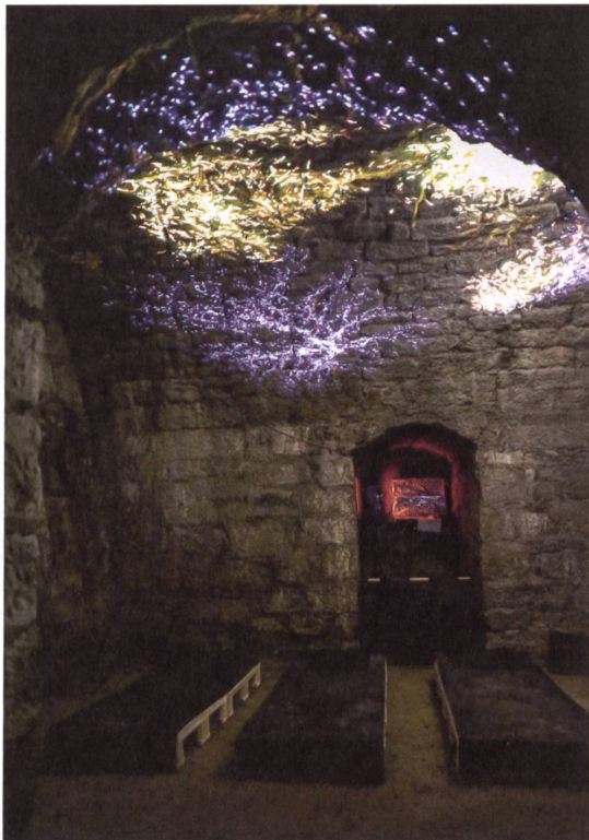
Auf den Meditationsmatten liegend, lassen sich die Bewegungen der Pilzpartikel durch tiefe Atemzüge beeinflussen.