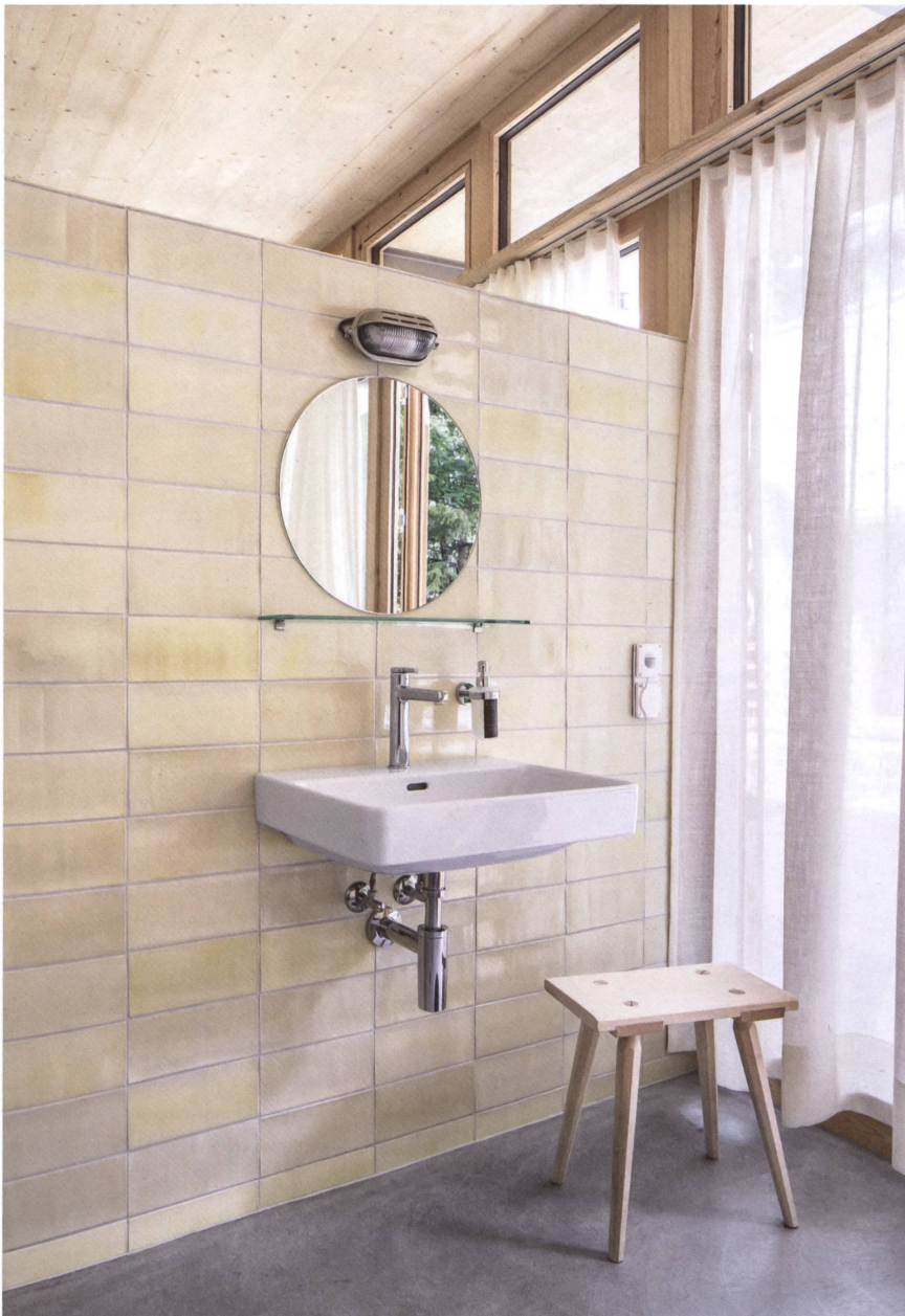
Im neuen Badebereich des Kurhauses Berggün variieren Farbe und Glanz der handgefertigten Porzellankacheln leicht.