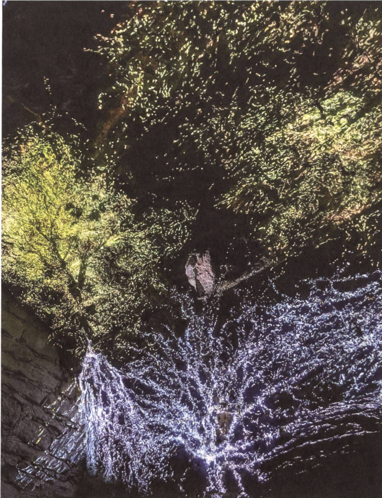
Die Projektion «Breath Beneath» bildet im alten Gewölbekeller ein interaktives Pilznetzwerk nach.