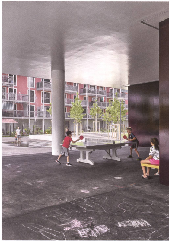
Siedlung Reitmen in Schlieren: Die Säulenhalle unter dem «Ozeandampfer».

Stadsiedlung Reitmen, 2020 Badenerstrasse 90–114, Schlieren ZH Bauherrschaft: Anlagestiftungen Turidomus und Adimora, geführt von Pensimo Management, Zürich Architektur: Haerle Hubacher, Zürich (Gesamtkonzept sowie Häuser 3, 4, 5); Steib Gmür Geschwenter Kyburz, Zürich (Häuser 1, 2, 6) Landschaftsarchitektur: Raderschall- partner, Meilen Baumanagement und Baurealisation: GMS Partner, Zürich Baukosten (BKP 1–9): Fr. 82 Mio.