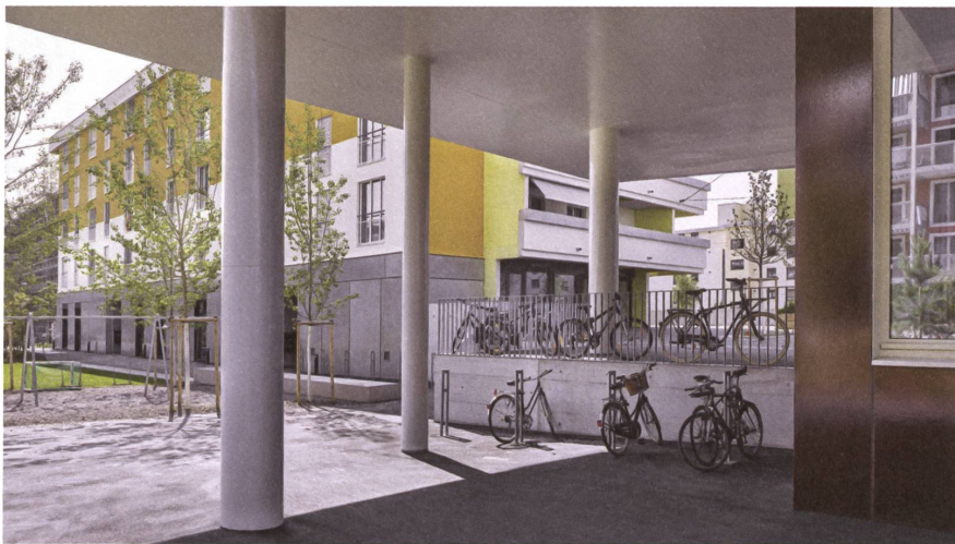
Die Säulenhalle ermöglicht Durchblicke und Durchgänge.