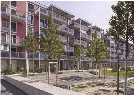
Bänke und Stufen am Spielplatz.