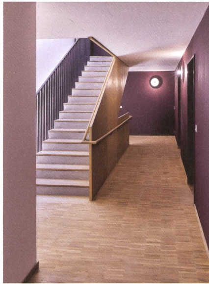
Wohngefühl im Treppenhaus ...