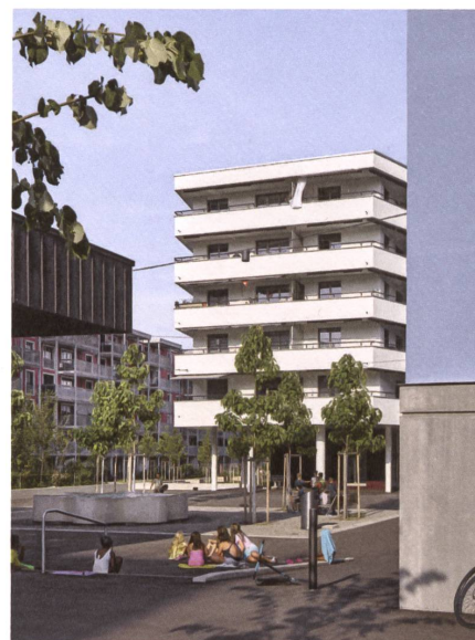
Trottinett-Treff am Brunnen.

→ und Bewegung untersucht. Es zeigte sich, dass Menschen eher bereit sind, weiter zu gehen, wenn sie andere Menschen sehen. Übertragen auf suburbane Baustrukturen bedeutet das, Wege zu bündeln. Plant man zu viele Wege, besteht die Gefahr, dass die Menschen sich zu sehr verstreuen. «Besser weniger Routen planen, die dafür rege benutzt und belebt werden», empfiehlt Erath.