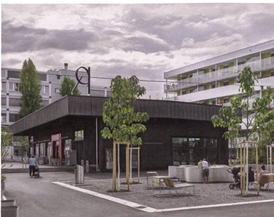
In Gehdistanz: der Lebensmittelladen auf dem Areal.