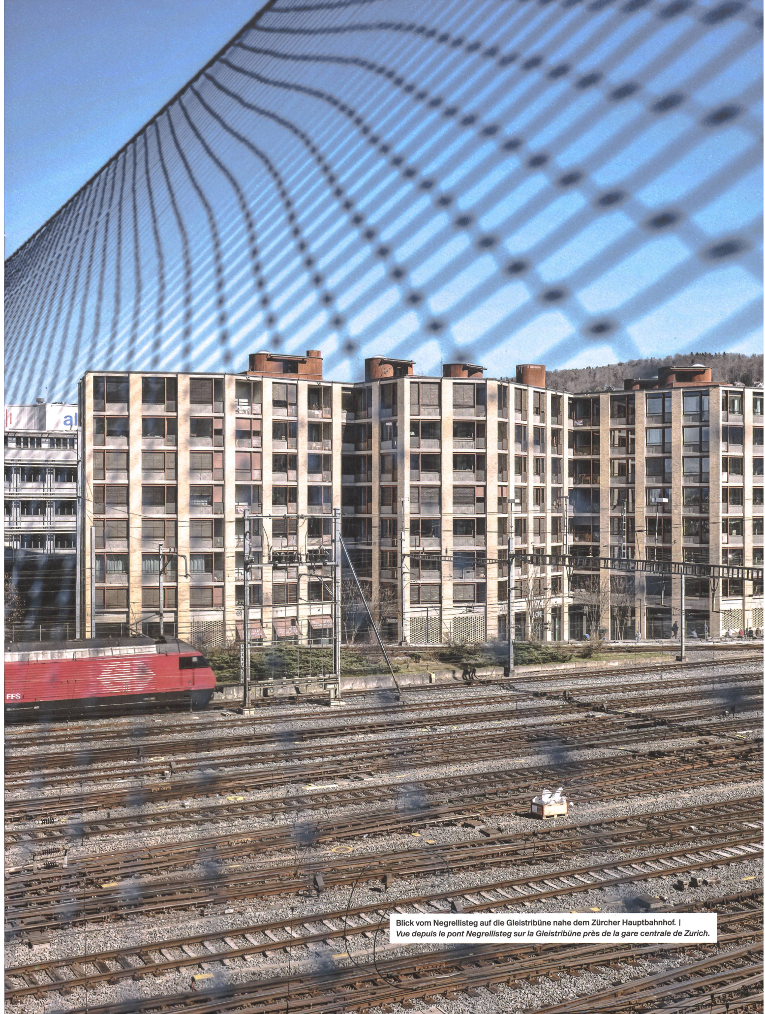
Blick vom Negrellisteg auf die Gleisribüne nahe dem Zürcher Hauptbahnhof. | Vue depuis le pont Negrellisteg sur la Gleisribüne près de la gare centrale de Zurich.