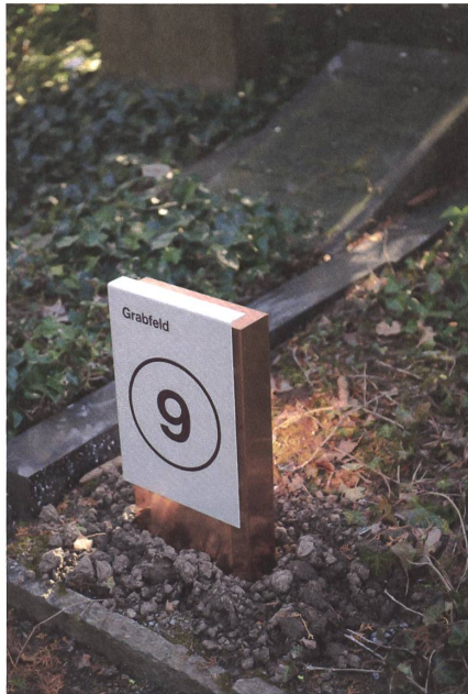
Auch dort, wo die Grabfelder nicht systematisch geordnet sind, soll das neue Signaletiksystem für mehr Orientierung sorgen.