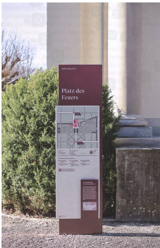
Weil die Wege keine Namen tragen und Grabfelder nicht logisch nummeriert sind, haben die Grafikerinnen neue Plätze definiert, die durch die Anlage leiten.