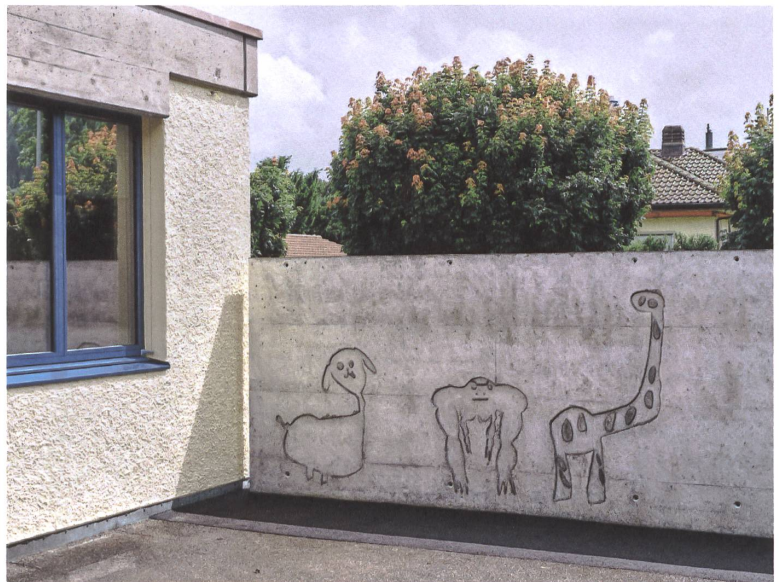
Die Tiere im Beton haben die Kindergartenkinder gezeichnet.