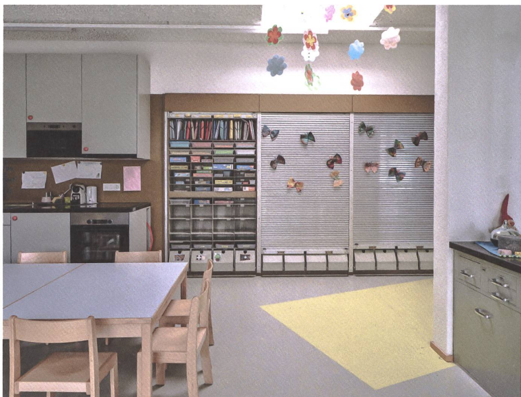
Die alte Briefkastenanlage dient als Regal und den Kindern zum Spielen.

Die Umwidmung ist auch ökonomisch interessant – gerade in einer bürgerlich regierten Landgemeinde kein unwichtiger Faktor: Nur 880 000 Franken hat sie gekostet. Der Umbau ist aber vor allem eins: baukulturell packend. Die Architekten verdichten heute und gestern zu einem poetischen Ganzen. Der Umbau nimmt Dinge auf und verfremdet sie: analoge Architektur mit belgischen Einflüssen, könnte man sagen. Das Resultat ist eine frische Baukultur mit historischem Dreh. Die wichtigste Erkenntnis: Die Architekten verstehen Suffizienz nicht als ökologisches Dogma, sondern als kulturellen Wert – Verzicht als Reichtum statt als Askese. ●