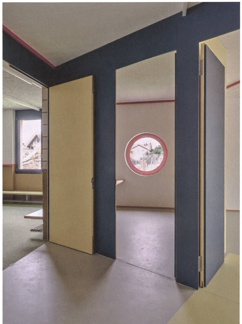
Holzwände unterteilen den Raum schräg, sodass er von der Garderobe in den Hauptraum fliesst.