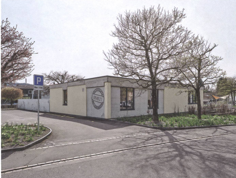
Den ehemaligen Kundenzugang haben die Architekten mittels zweier Betonmauern geschlossen.