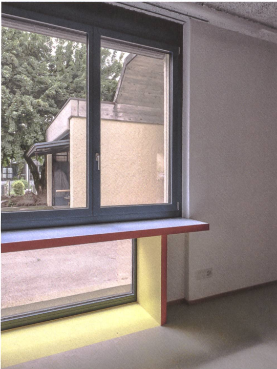
Dank der neu verglasten Brüstung sehen auch die Kleinen hinaus.