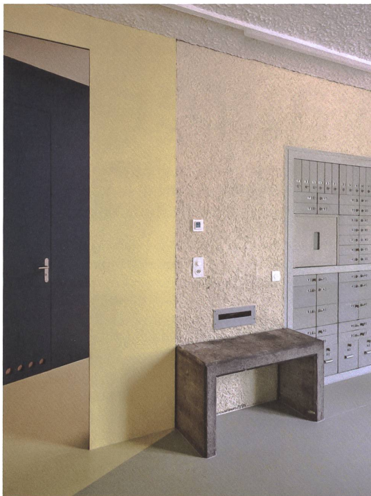
Selbst die Betonbank und der Briefschlitz blieben erhalten.

Umbau Kindergarten Alte Post, 2021 Poststrasse 1, Hunzenschwil AG Bauherrschaft: Einwohnergemeinde Hunzenschwil Architektur, Generalplanung: Weber Weber, Zürich, mit Schmid Schärer, Zürich; Mitarbeit: Dijana Fontana und Moritz Weber (Co-Projektleitung), Simon Jenni (Projektarchitekt) Landschaft: Rosenmayr Landschaftsarchitektur, Zürich Tragwerk: Franz Bitterli, Hunzenschwil Bauphysik: AIK Bauphysik, Zürich HLKS: Abicht, Aarau Elektroingenieur: Elcon, Suhr Kunst: Kindergartenkinder Hunzenschwil Bausumme (BKP 1-9): Fr. 0,9 Mio. Baukosten (BKP 2): Fr. 0,7 Mio.