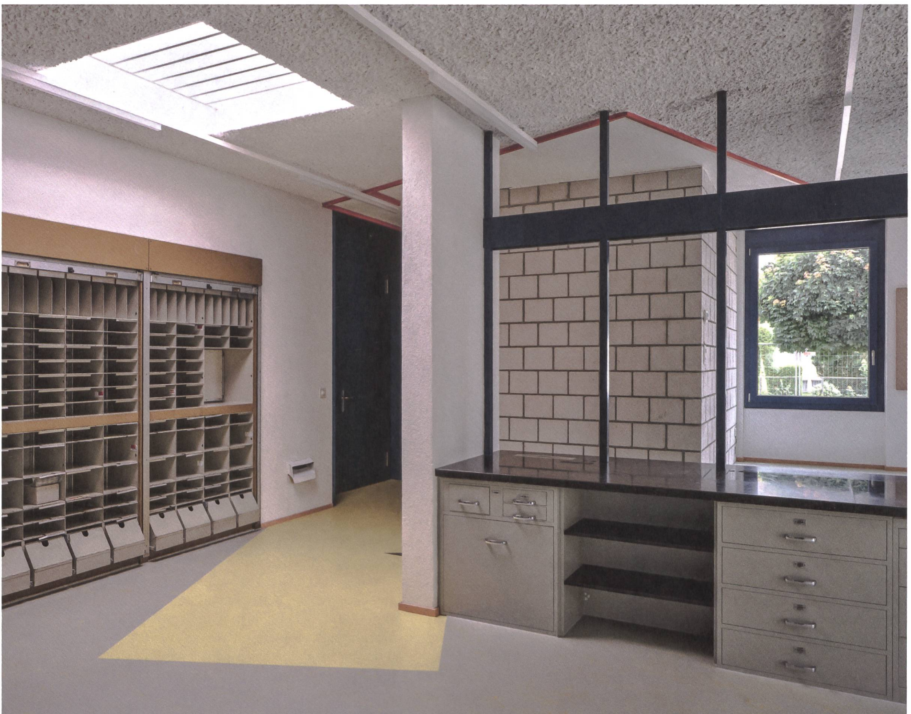
Die Post in Hunzenschwil wurde zum Kindergarten: Die Briefkastenanlage, der Steintresen und die Schubladen erinnern an die ehemalige Nutzung.

Text: Andres Herzog