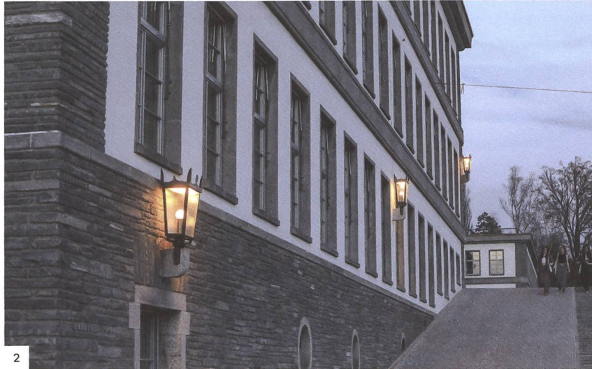
1–3 Kantonsschule Im Lee in Winterthur: Die historischen Leuchten erstrahlen nun in neuem Glanz.