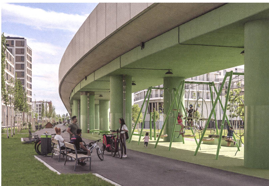
Das geschwungene, grün gestrichene Band des Trassees zieht sich mitten durch das Wohnquartier Am Seebogen.

So wurde – nach der Europaallee in Zürich – ein zweites Projekt von Krebs und Herde zum Schlagball der Klimadiskussion. Der Landschaftsarchitekt Matthias Krebs begrüsst die nachträglichen Forderungen nach mehr Grün und Schatten genauso wie die nach zusätzlichen Bäumen in der Seestadt und räumt ein, dass heute wohl hellere und versickerungsfähige Oberflächen zum Einsatz kämen. Im Gegensatz zu grünen Rabatten in Bodennähe leisten grosse Baumkronen allerdings einen viel effektiveren Beitrag zur Verbesserung des Klimas. Die gärtnerischen Interventionen beurteilt er deshalb kritisch: «Nicht nur in der Architektur, auch im Aussenraum sollte sich der Zentrumscharakter des Seeparkquartiers widerspiegeln. Aus einem städtischen Raum einen Garten zu machen und dabei die Qualitäten der verschiedenen Freiräume zu egalieren, wirkt beliebig.» Kopecek hält entgegen, dass der Vorschlag von Krebs und Herde, bloss mit der Pflanzung zusätzlicher Bäume auf die Kritik aus der Bevölkerung →