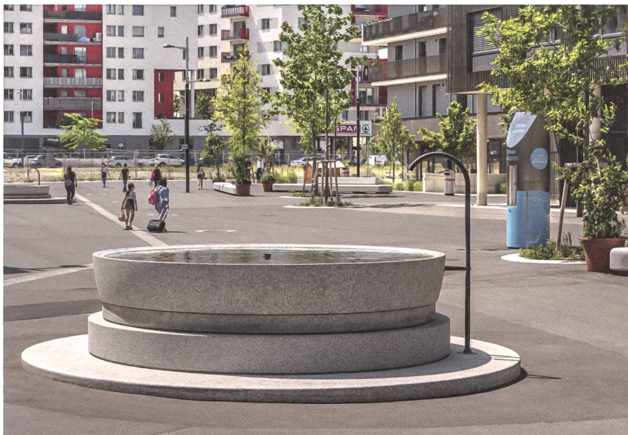
Anstelle der Brunnen lieferte im Frühling die blaue Standard-Trinksäule Wasser.

→ und wie die entsprechenden Bedürfnisse aussehen», argumentiert Kopecek, darum bemüht, die Gewerbetreibenden als Mieter nicht zu verlieren. «Derzeit sind noch 60 Prozent der Seestadt umzusetzen. Für uns ist ein guter Ruf wichtig, um weiterhin für die passenden Unternehmen attraktiv zu sein.» So stimmten die Beteiligten einer Reduktion der Marktfläche zu, um Platz für mehr Bäume, Grünflächen und Wasserelemente zu schaffen.