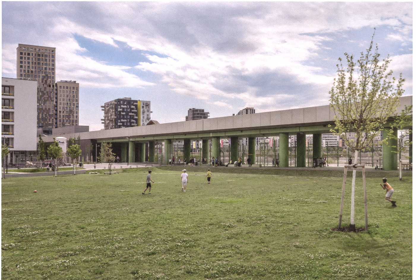
Gewachsenes und gebautes Grün: Am Elinor-Ostrom-Park nehmen die Säulen des Bahntrassees die Farbe des Rasens auf.