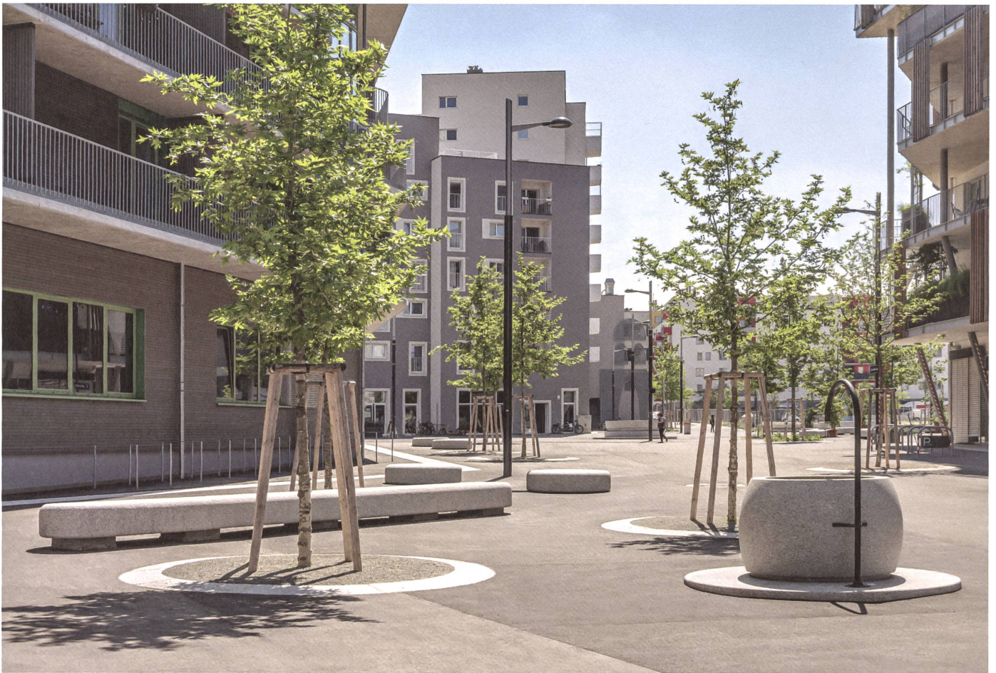
Entschärfung der asphaltierten Hitzeinsel: Der Simone-de-Beauvoir-Platz hat in einer Nachbesserungsaktion Platanen erhalten.