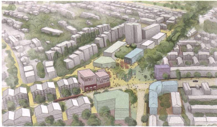
... zu einem lebendigen Quartierplatz werden.