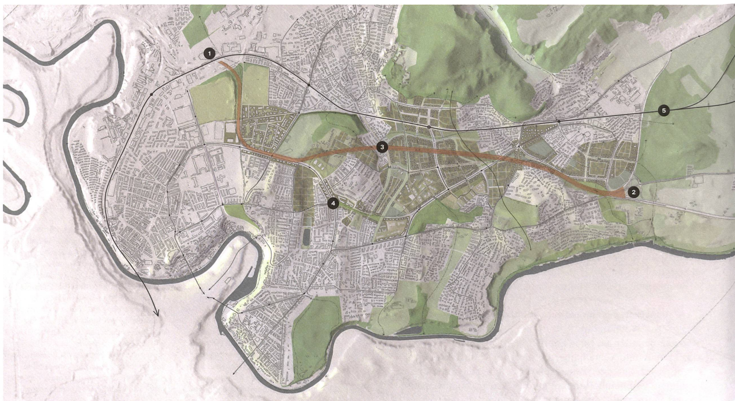
Die Autobahn A6 soll zwischen den Anschlüssen Bern-Wankdorf 1 und Muri 2 in einem Tunnel 3 verschwinden. Das bietet grosse städtebauliche Chancen für das Gebiet dazwischen, etwa am Freudenbergplatz 4. Nördlich davon die Bahnlinie Bern-Thun 5.