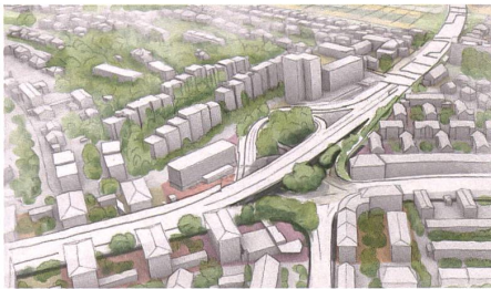
Der Freudenbergplatz soll vom Restraum unter dem Autobahnanschluss ...