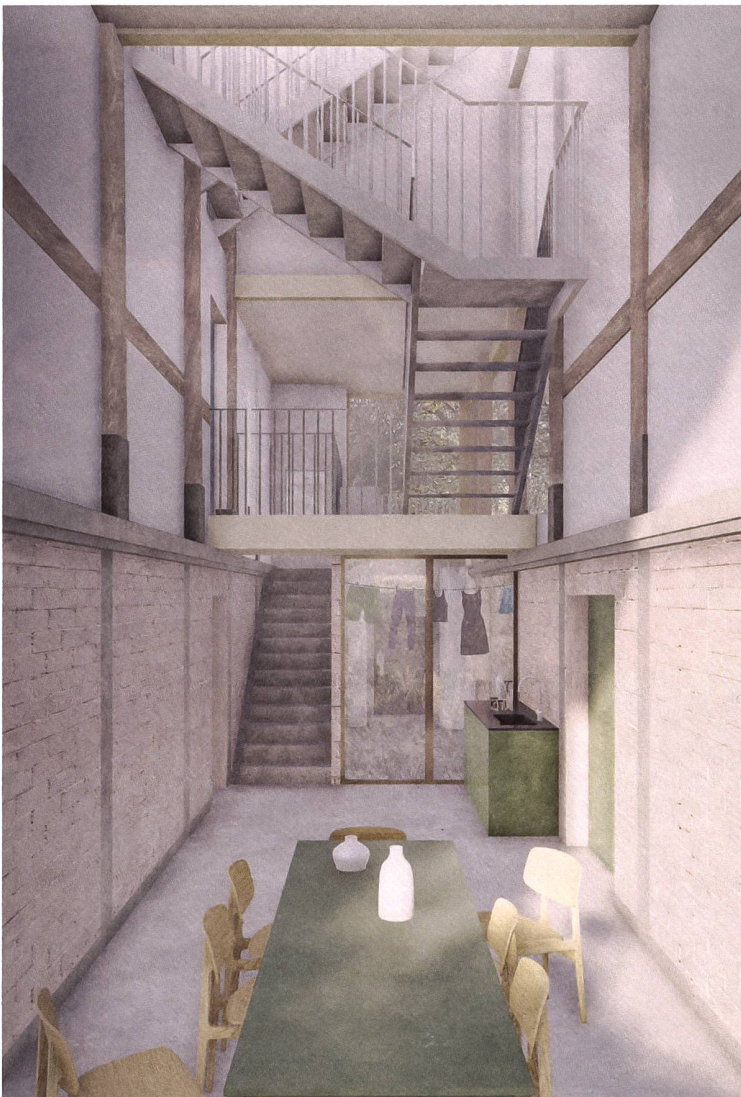
Die Halle in der Mitte dient als Hauptraum und als Treppenhaus. Visualisierung: Architekten