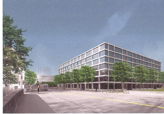
Arge Graziosi Krischanitz Wettbewerb 2006, 3. Rang