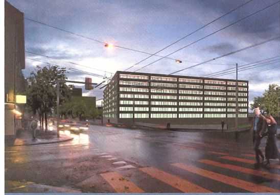
Stauer & Hasler / Bosshard & Luchsinger Wettbewerb 2006, 2. Rang