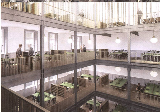
Zentrale Halle im Wettbewerbsprojekt von Spillmann Echale Architekten, 2020.