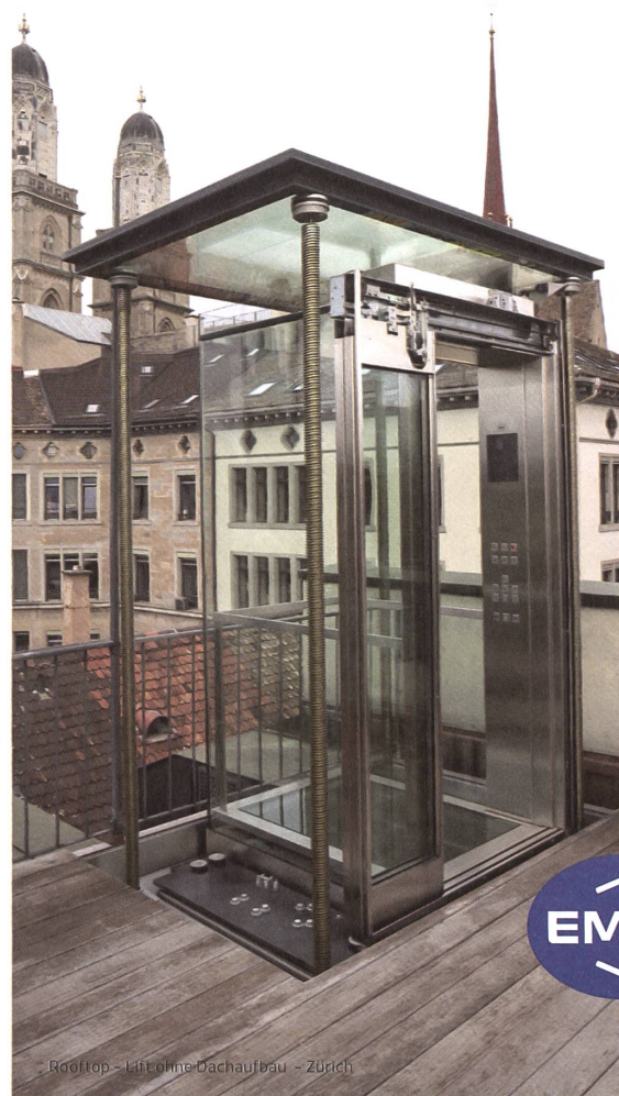
RodTop - Lifelohne-Dachaufbau - Zürich

Bewegt weltweit – Massarbeit aus der Lift-Manufaktur.