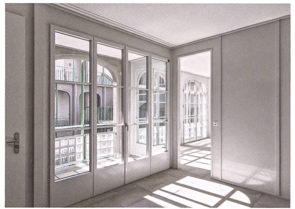
Zum Innenhof hin liegen die lichtdurchfluteten Laubenzimmer.