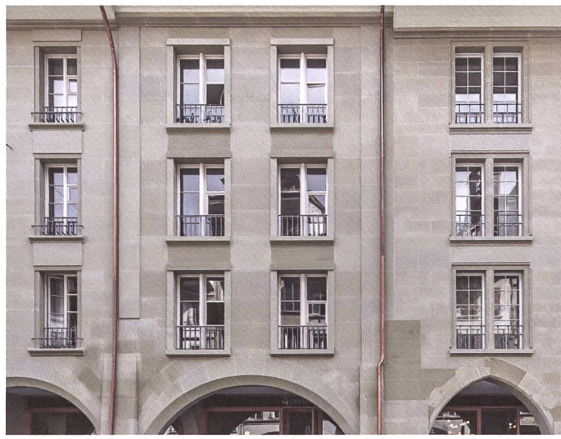
Zur Rathausgasse hin haben die Architekten neue Fassaden entworfen.