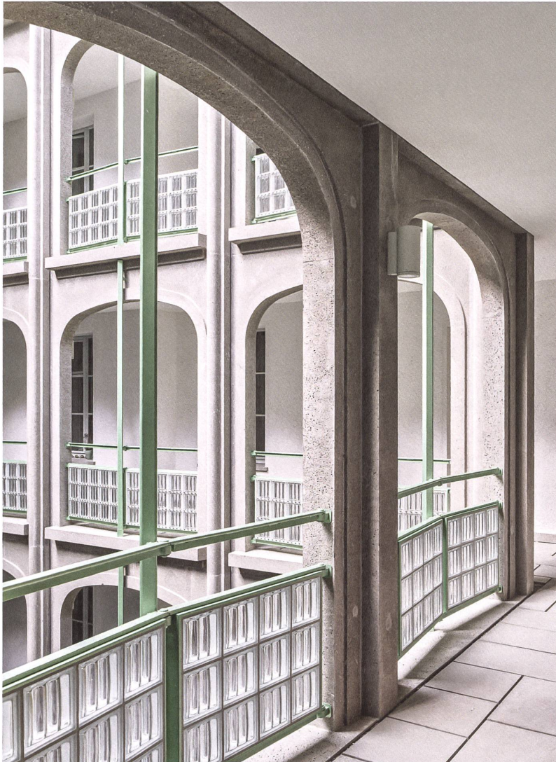
Laubgänge erschliessen die Wohnungen.