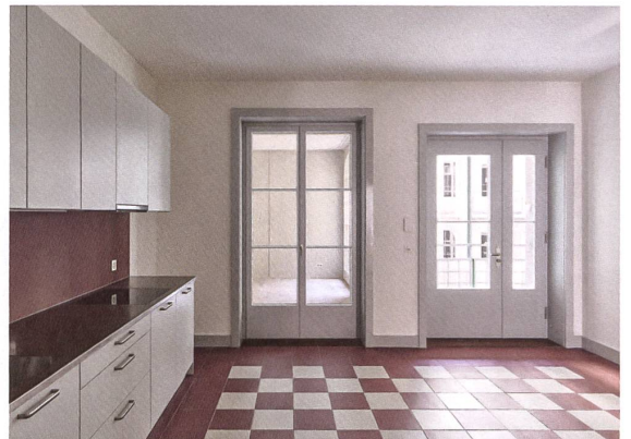
Von der Laube gelangt man direkt in die grosszügige Küche.