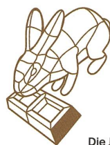
Die Jury sagt