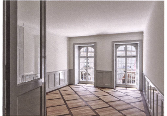
In den gassenseitigen Räumen wurde typisches Berner Parkett verlegt.