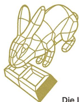
Die Jury sagt

Sitzmöbel aus Aluminiumsandguss Design: Moritz Schmid, Ville Kokkonen Konzept: Moritz Schmid, Ville Kokkonen, Heinz Caffisch Industriepartner: Christenguss, Bergdietikon AG Material: rezykliertes Aluminium Ausstellungspartnerin: Galerie Okro, Chur