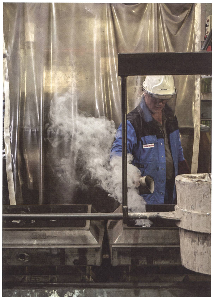
Die 1923 gegründete Giesserei Christenguss erforscht seit ein paar Jahren das Potenzial von digitalen Produktionsverfahren.