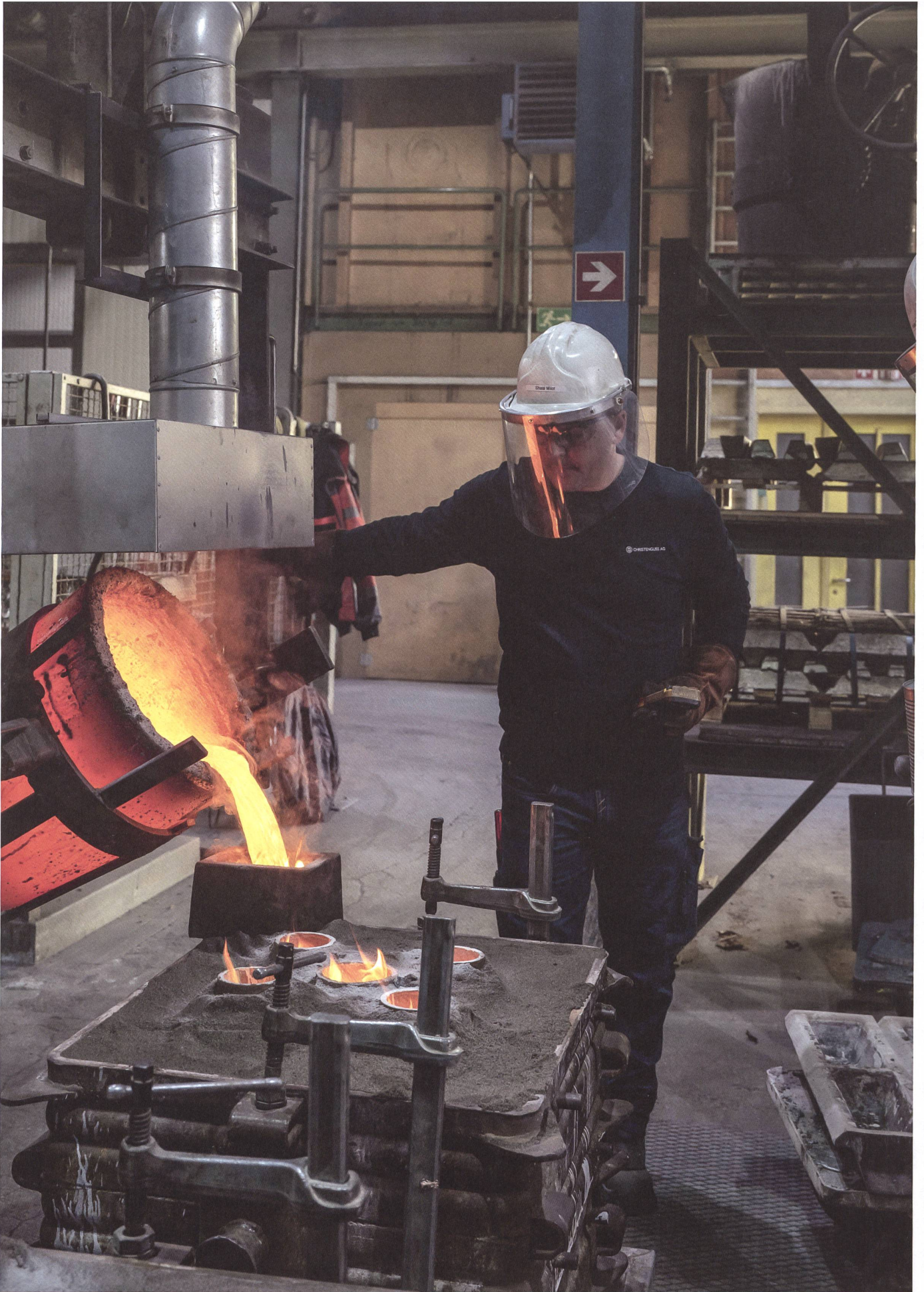
Flüssiges Aluminium fließt in die mit dem hauseigenen 3-D-Drucker hergestellten Sandgussformen.