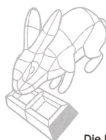
Die Jury sagt