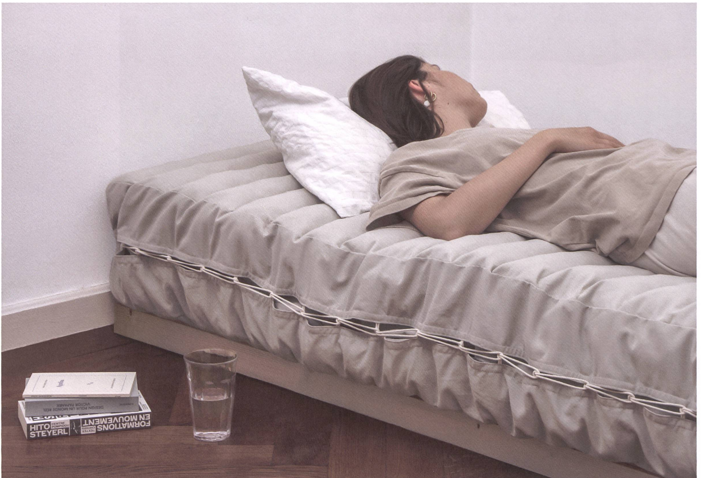
Eine Matratze, in der viel Wissen um Entsorgungsmethoden und traditionelles Handwerk steckt – und die Reste einer alten Matratze aus dem Familienbesitz der Designerin.

→ um Hygieneansprüchen gerecht zu werden. Wir leben in einer Zeit, in der solche Fragestellungen eine neue Relevanz erhalten – nicht nur wegen Covid, auch das Thema Allergien wird immer aktueller, und viele Herstellerinnen bieten aus diesem Grund Allergikermodelle an. Ein weiteres Hindernis bei der Wiederverwendung von Matratzenbestandteilen: In der Schweiz mangelt es an Unternehmen, die Gegenstände zerlegen und deren Komponenten wieder in Umlauf bringen. Zirkularität ist in der Designwelt zwar in aller Munde, aber mit der Umsetzung in die Praxis hapert es häufig noch.