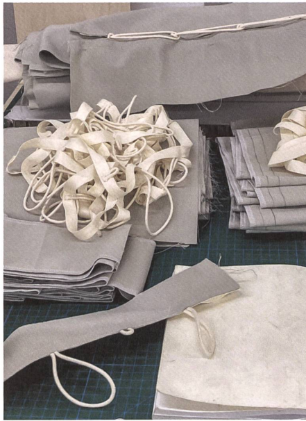
Die Matratze lässt sich am Ende ihrer Lebensdauer einfach in ihre Einzelteile zerlegen.