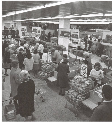
Grosser Andrang im neuen Lebensmittelverein Zürich.