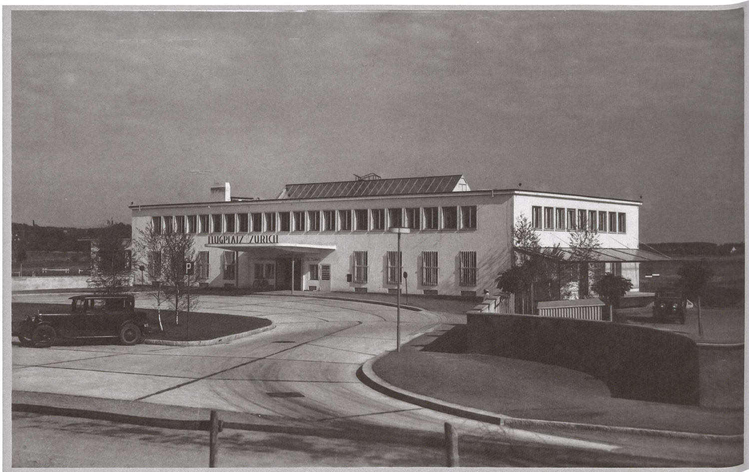
Das Abfertigungsgebäude des Flugplatzes Zürich der Architekten Kündig & Oetiker kurz nach der Fertigstellung, 1932.

Text und Plan: Werner Huber, Fotos: ETH-Bibliothek, Bildarchiv