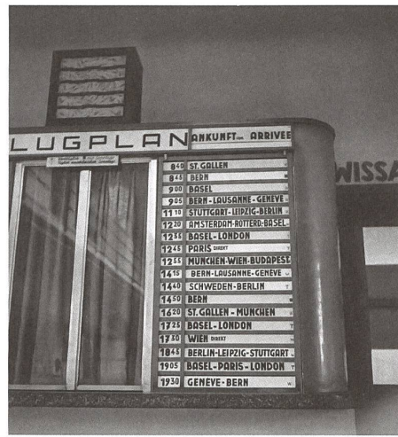
Flugplan mit Anknunftstafel.