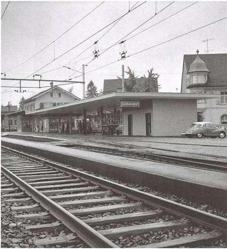
Bahnhof Dübendorf mit Anbau von Max Vogt, 1967.