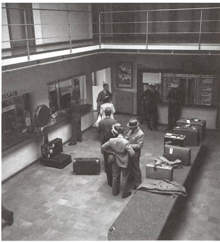
Passagierhalle im Abfertigungsgebäude.