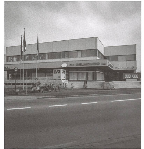
Das City Center von Klemenz + Flubacher, 1972.

→ Mit knapp 47000 Flugbewegungen – davon 31000 Jetflüge – war 1985 das verkehrsreichste Jahr. 2005 beschloss die Armee, den Flugplatz Dübendorf zu schliessen, und noch im selben Jahr wurde der Jetflugbetrieb eingestellt. Seither laufen die Diskussionen um die künftige Nutzung des Flugplatzareals siehe Seite 30.