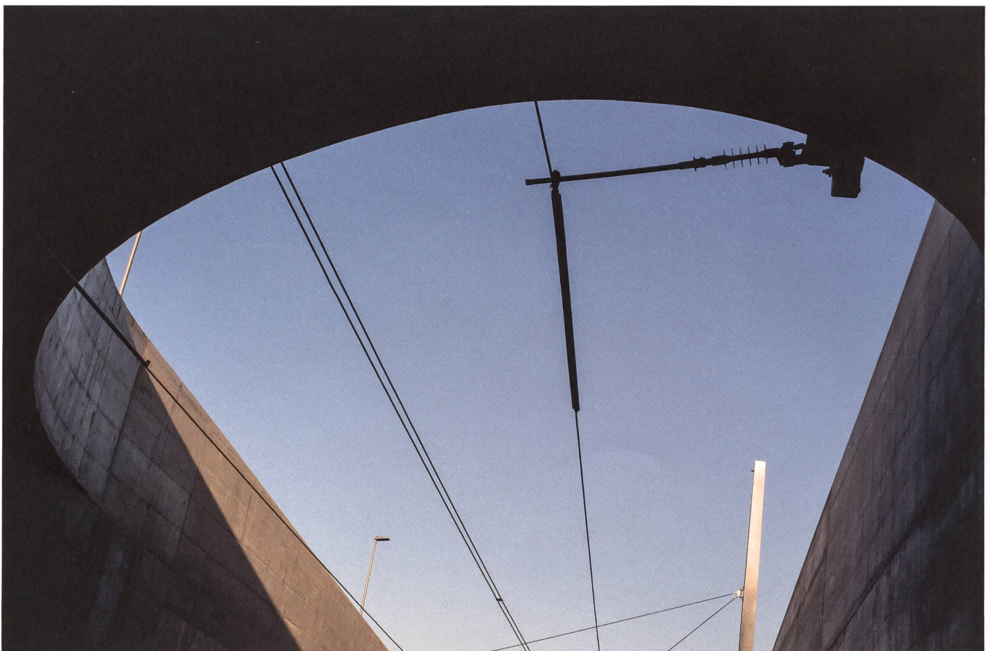
Killwangen: Die Überwerfung Zürcherstrasse zeigt die typischen Gestaltungsmerkmale des Konzepts von 10:8 Architekten. →