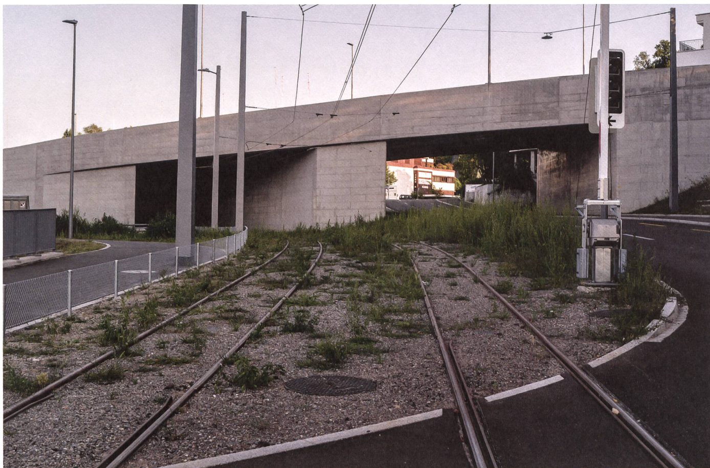
Killwangen: Bei der Überwerfung Zürcherstrasse unterfahren die Limmattalbahn und die Bahnhofstrasse die Zürcherstrasse. →