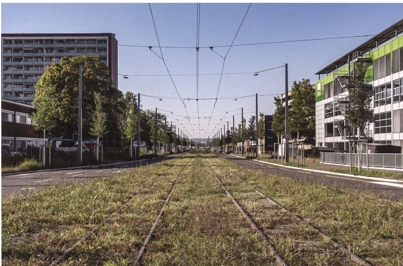
Spreitenbach: Standardquerschnitt der Stadtbahn mit Grünrassee und beidseitiger Baumreihe. →