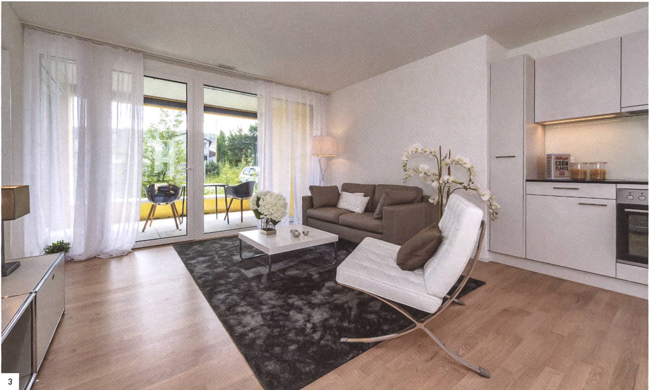
3 Extragrosse Fenster bei den Loggien sorgen für hellen Wohnraum im Salmenpark.

→ System gehört seit 2018 zum Sortiment, gilt als langlebig und pflegeleicht und ist als Kunststoff- oder Kunststoff / Aluminium-Fenster erhältlich. Es ist flächenbündig, halbflächenversetzt oder flächenversetzt einsetzbar — für den Salmenpark hat das Architekturbüro die üblichste Variante verwendet: halbflächenversetzt. Die Aluminiumbeschichtung sorgt für eine robuste Oberfläche der Fensterrahmen. Zudem kann man das Aluminium lackieren oder veredeln — sofern gewünscht; rein konstruktiv sind Anstriche oder Lasuren nicht nötig. Beim «Salmenpark 2» sind die annähernd 800 Fensterprofile im Aluminium-Naturton farblos eloxiert. Durch die Lichtreflexion auf dem Metall schimmern die Fensterrahmen eine Spur heller als die Putzfarbe, sodass die Fenster durch die sanft leuchtende Umrandungslinie visuell betont sind.