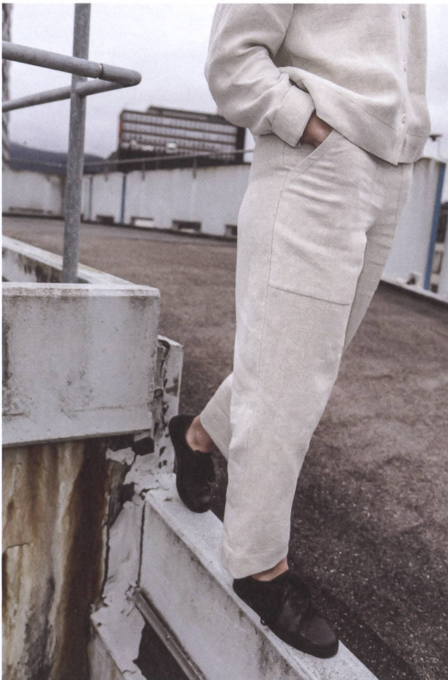
Einige Kleidungsstücke sind als Unisex-Teile konzipiert.