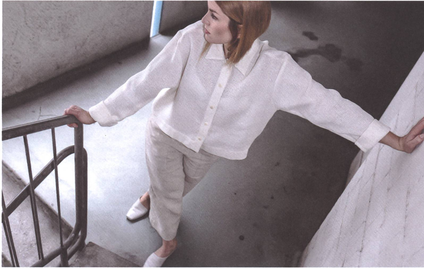
Sämtliche Teile der Myn-Kollektion «Etern» bestehen aus handgewebtem Flachs respektive Leinen.