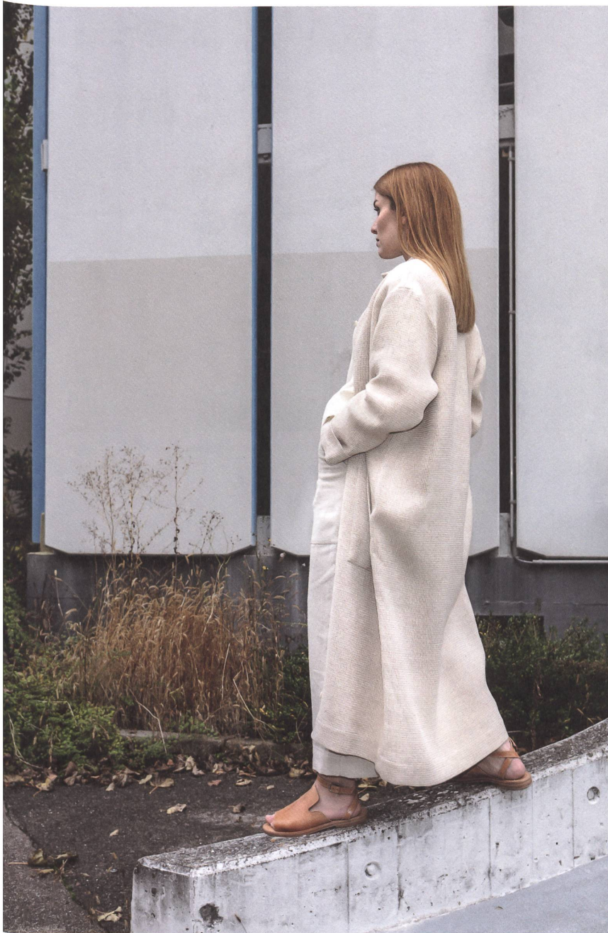
Die Myn-Kollektion gibt es nur in zwei Grössen. Deshalb verwenden die Designerinnen bewusst lockere Schnitte mit abfallender Schulter.

→ Auf den ersten Blick scheint die Lösung also einfach. Flachs – oder Leinen, wie das daraus versponnene Garn auch heisst – ist ein nachwachsender Rohstoff. Die sehr robuste pflanzliche Faser benötigt für ihr Wachstum wenig Wasser. Anbau und Weiterverarbeitung sind fast CO 2 -neutral, Naturfasern und Nahrungsmittel wachsen auf derselben Fläche – eine blühende Kultur im Agrarökosystem. Zudem sind Rückverfolgbarkeit und faire Löhne entlang der gesamten Wertschöpfungskette gewährleistet.