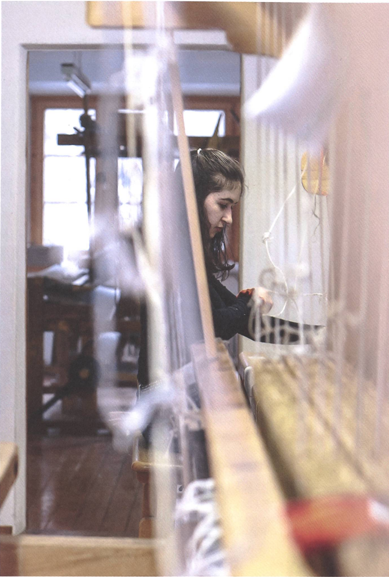
Die Handweberei Tessanda produziert für Myn 60-Meter-Stoffbahnen. Industriebetriebe fordern die vierfache Bestellmenge.