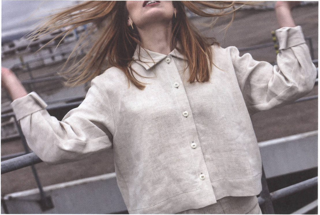
Handarbeit macht das Gewebe zum grössten Kostentreiber in der Produktionskette. Die industrielle Herstellung wäre günstiger, erfordert aber riesige Mengen.