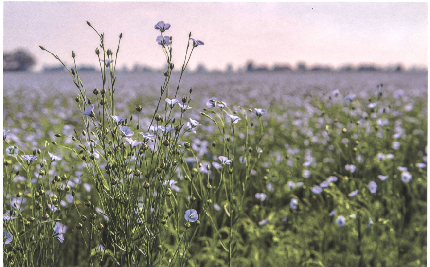
Flachs, in der Schweiz einst grossflächig angebaut, wächst heute wieder auf sieben Hektaren. Für den Anbau der robusten Pflanze sind nur geringe Wassermengen nötig.