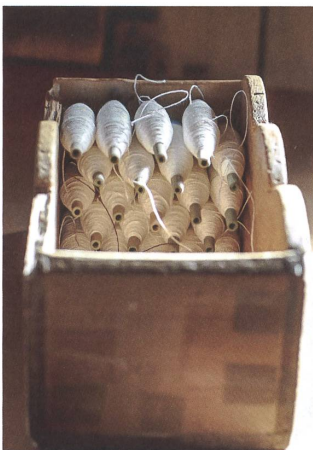
Vierzig Stunden und zahlreiche Garnknoten braucht es, bis ein Handwebstuhl für die Arbeit eingerichtet ist.