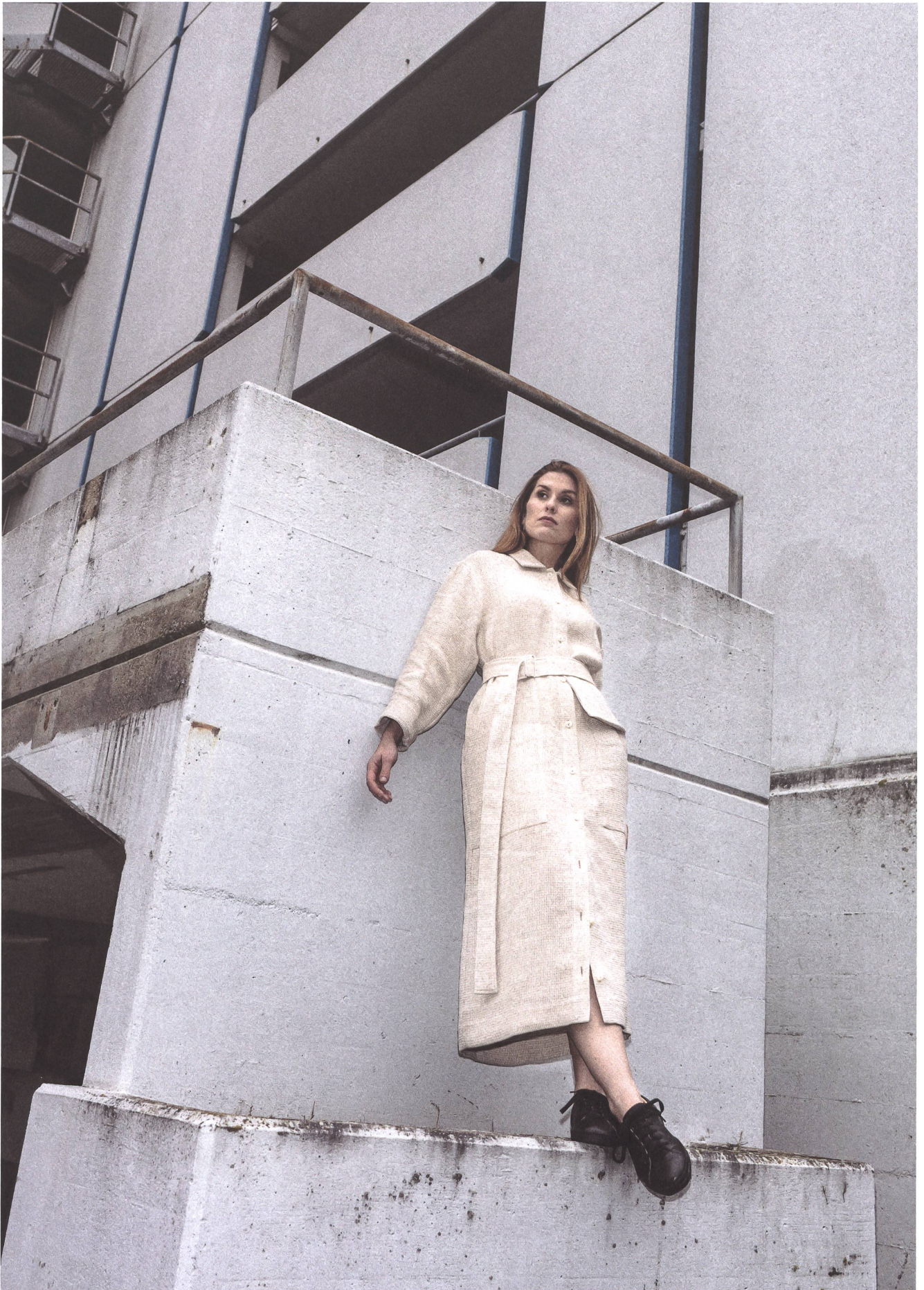
Schlichte Schnitte und eine hohe Verarbeitungsqualität sollen die Kleidungsstücke von Myn zu Langzeitbegleitern machen.