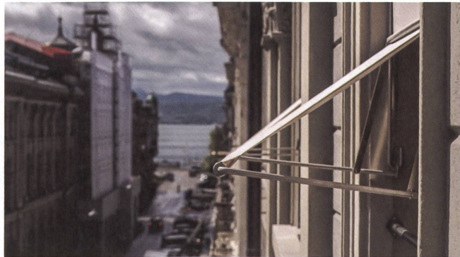
Filigrane Ausstellstore mit beigefarbenem Stoff.