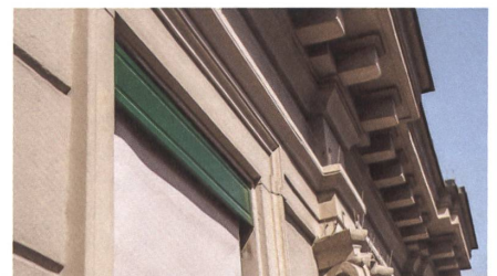
Die Abdeckbleche mit Vertiefung prägen das Fassadenbild mit.