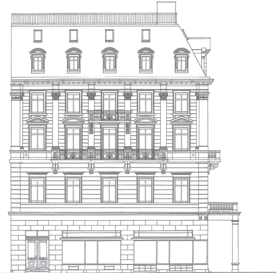
Fassade an der Fraumünsterstrasse. Plan: Alessandro Vassella