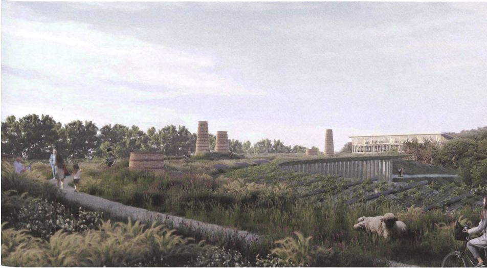
Ein schlangenförmiger Erdwall als Lehrgebäude: der zweitplatzierte Vorschlag von Pont12 Architectes.