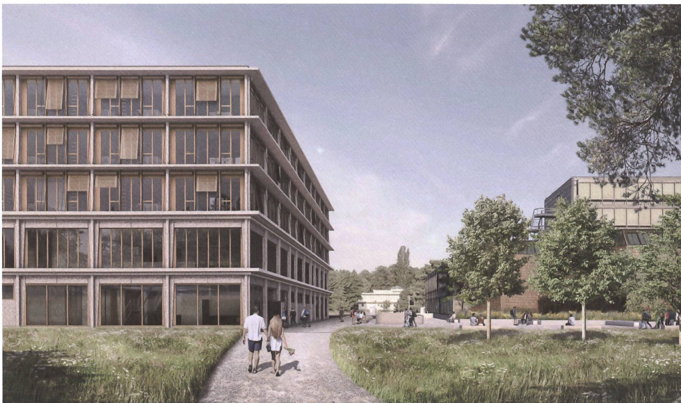
Eine kompakte Kiste aus Beton und Holz für das neue Lehrgebäude der Universität Lausanne: das erstplatzierte Projekt, entworfen von Background Architecture.