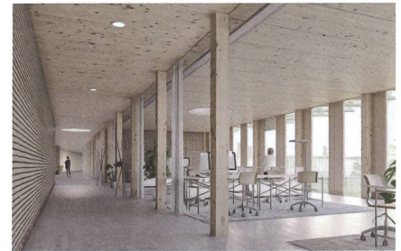
Innenraumbild des zweitplatzierten Projekts.