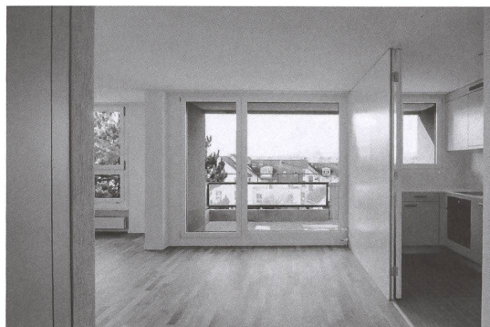
Eine der sanierten Wohnungen.