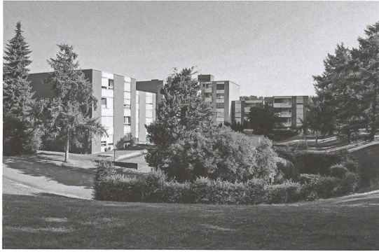
Die Siedlung vor der Sanierung.