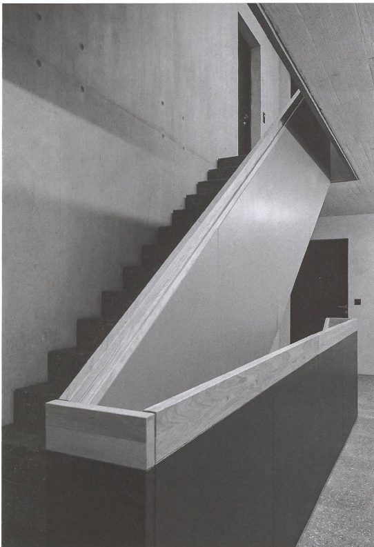
Sorgfältig materialisiertes Treppenhaus.

Energiebezugsfläche: früher 7721 m 2 , neu 18 395 m 2 CO 2 -Emissionen: früher 42,55 kg / m 2 Energiebezugsfläche, neu voraussichtlich nahezu null GEAK: früher F, E, neu voraussichtlich A, B (Minergie-Zertifikat)