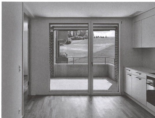
Aus den Neubauten blickt man teils idyllisch ins Grüne.