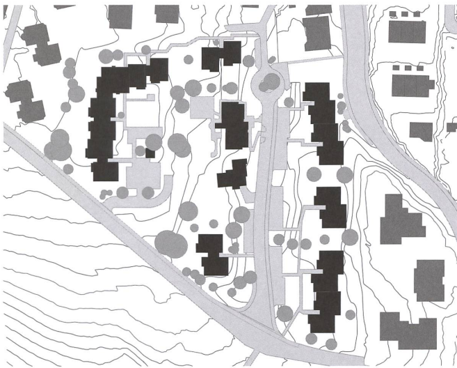
Situation Siedlung Tüfwis zwischen 1974 und 2019.