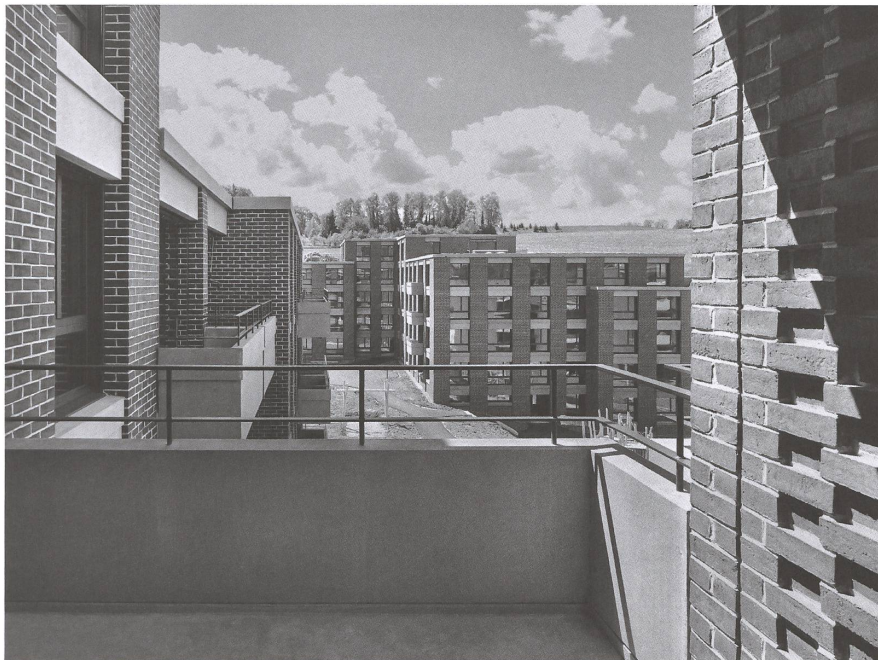
Die markanten Neubauten mit Klinkerfassade der Siedlung Tüfwis.