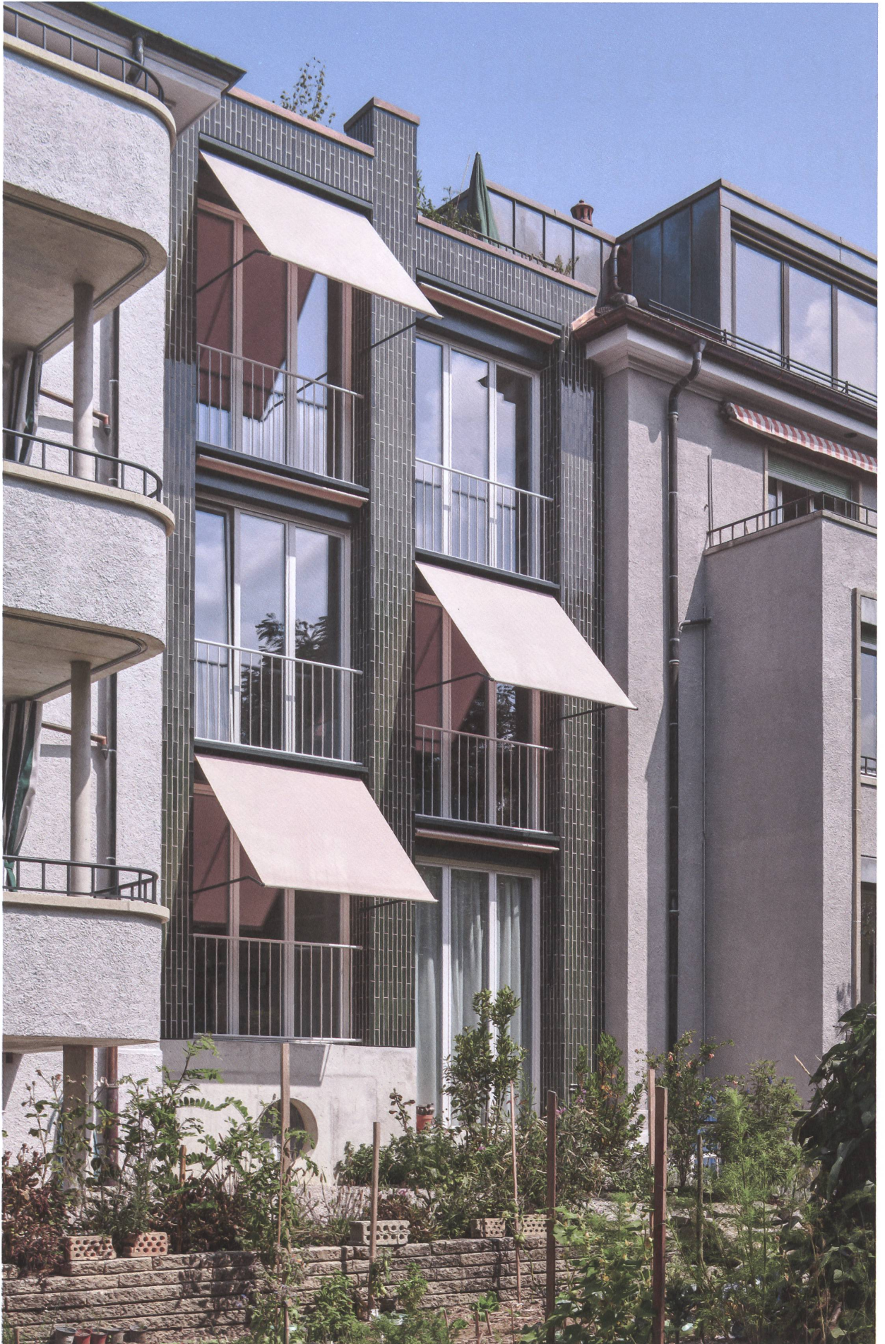
Der Zwischenbau nimmt die unterschiedlichen Höhen des Bestandes auf und fügt sie zu einem Ganzen.