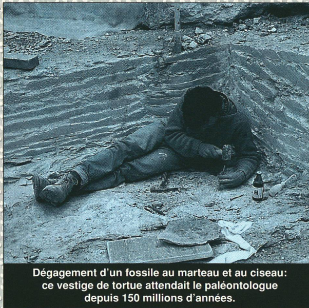
Dégagement d'un fossile au marteau et au ciseau : ce vestige de tortue attendait le paléontologue depuis 150 millions d'années.

La couche Rätschenbank est actuellement citée comme