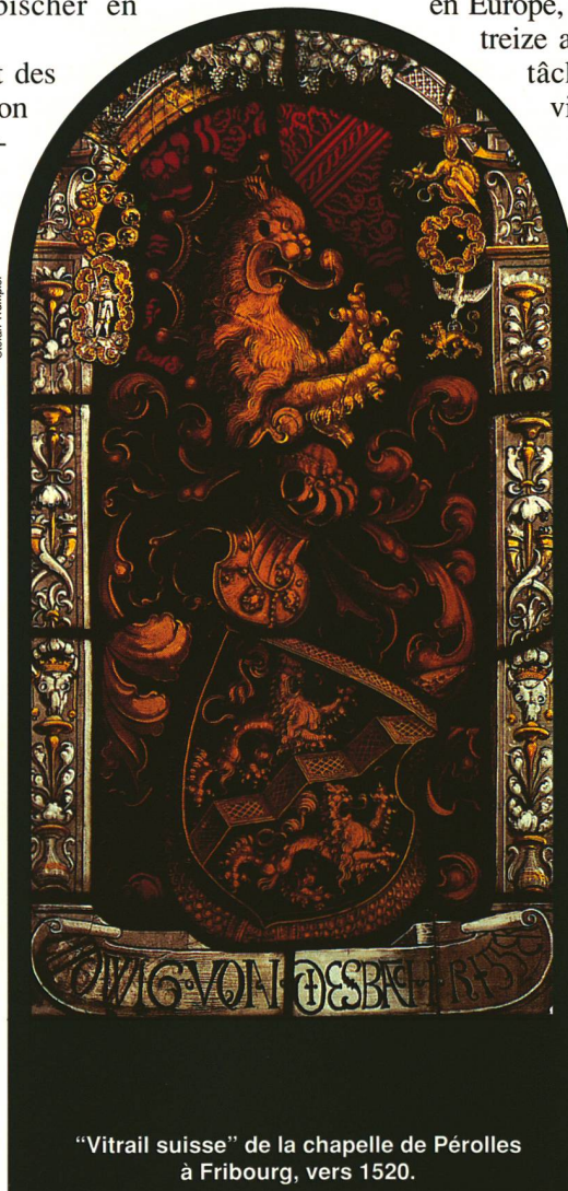
"Vitrail suisse" de la chapelle de Pérolles à Fribourg, vers 1520.

A l'occasion du 700 e anniversaire de la Confédération, le Musée du vitrail de Romont (canton de Fribourg) organise, de mars à novembre 1991, une exposition intitulée "Vingt-six fois le vitrail en Suisse" Tél: (037) 52 10 95