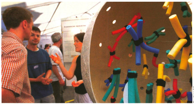
Discussion autour d'un modèle de noyau de cellule humaine avec chromosomes.

« Horizons », Fonds national suisse Wildhainweg 20, 3001 Berne fax: 031 308 22 65, E-mail: pri@snf.ch