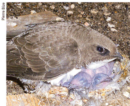
Les martinets alpins ( Apus melba ) nichent sous les toits des hauts édifices.

Animal Behaviour , (2006), 72, pp. 539-544