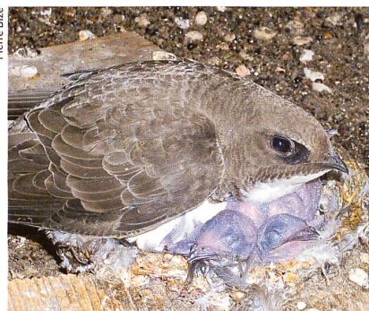
Les martinets alpins ( Apus melba ) nichent sous les toits des hauts édifices.

Animal Behaviour , (2006), 72, pp. 539-544