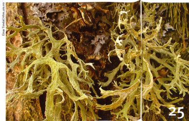
Les lichens recèlent encore beaucoup de mystères. Des chercheurs zurichois en ont élucidé quelques-uns.