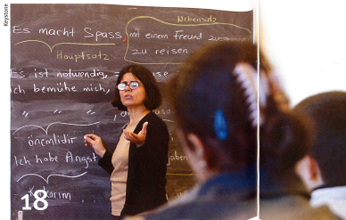
Des cours donnés dans leur langue maternelle améliorent les compétences linguistiques des jeunes étrangers.