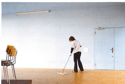
La précarité du travail et de l'emploi a aussi des conséquences négatives sur le bien-être psychique.

Le travail reste une valeur centrale de notre société. Encore glorifié il y a quelques décennies, il n'arrive pourtant parfois plus à assurer la survie économique, l'intégration sociale, la reconnaissance, l'estime de soi, autant de facteurs assurant la dignité humaine. En effet, divers indicateurs montrent que la dégradation des conditions de travail et d'emploi peut mener à l'exclusion sociale. Ce constat inquiétant est tiré de l'étude « Mécanismes d'intégration et d'exclusion par le travail ». Dirigée par