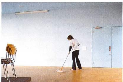
La précarité du travail et de l'emploi a aussi des conséquences négatives sur le bien-être psychique.

Le travail reste une valeur centrale de notre société. Encore glorifié il y a quelques décennies, il n'arrive pourtant parfois plus à assurer la survie économique, l'intégration sociale, la reconnaissance, l'estime de soi, autant de facteurs assurant la dignité humaine. En effet, divers indicateurs montrent que la dégradation des conditions de travail et d'emploi peut mener à l'exclusion sociale. Ce constat inquiétant est tiré de l'étude « Mécanismes d'intégration et d'exclusion par le travail ». Dirigée par