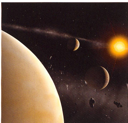
Illustration du système planétaire autour de l'étoile HD 69830.