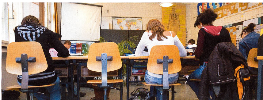
La plupart des élèves sèchent les cours parce que l'école les ennue.