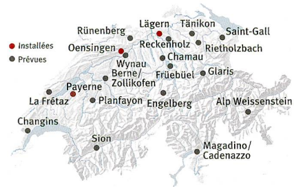
Sites des stations de mesures SwissSMEX Carte: Swisstopo/Studio2s, LoD

Ces résultats ont eu l'honneur d'une publication dans la revue Nature , mais restent le fruit d'une modélisation. « Depuis une dizaine d'années, les scientifiques ont vraiment pris la mesure de l'importance de ce paramètre qu'est l'humidité des sols. Des initiatives se mettent en place pour obtenir