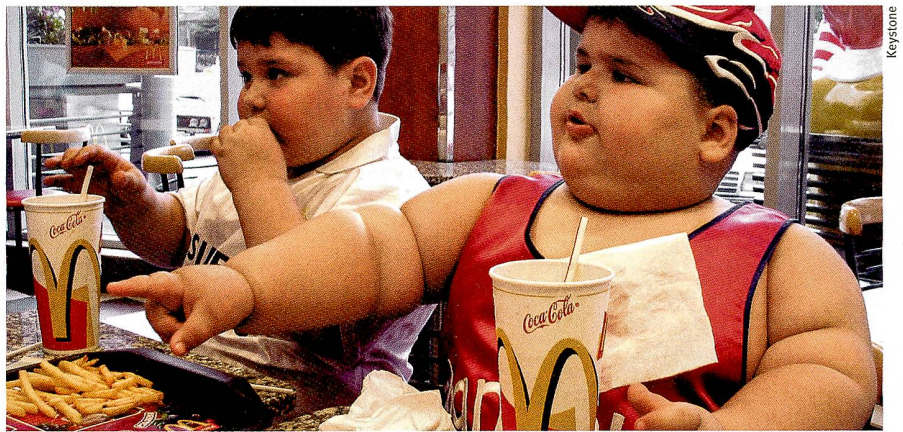
Eviter fast-food et boissons sucrées : plus un enfant est jeune et plus le message a des chances de passer.

Nature Immunology , vol. 9, pp. 424 - 431