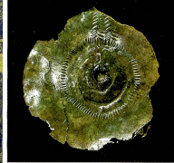
A gauche: Airolo-Madrano et le défilé de Stalvedro. Sur une éminence, dans le cercle au centre, les fouilles de Mött Chiaslasc. En haut: un fragment de bronze de Madrano Airolo datant de 1500 av. J.-C. En bas: fouilles sur le site de Mött Chiaslasc, en 2006.

L'arc alpin était donc à cette époque un « espace économique en plein boom », affirme Thomas Reitmaier, collaborateur scientifique du projet. L'exploitation du minerai, l'essor de la production de métal