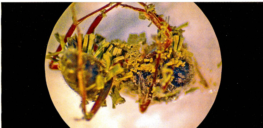
Une fourmi tuée par le champignon Metarhizium anisopliae (en vert).