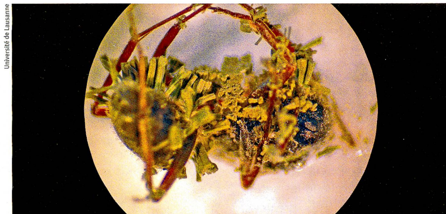
Une fourmi tuée par le champignon Metarhizium anisopliae (en vert).