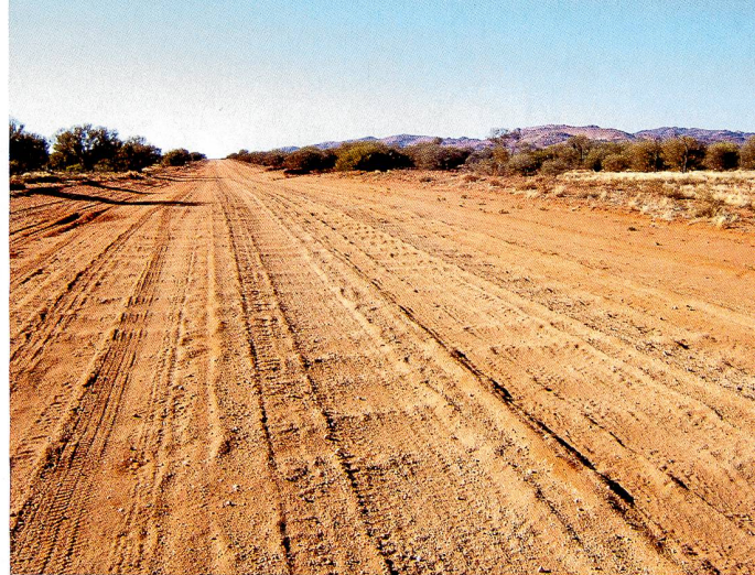
Les rides qui se forment sur les routes non goudronnées (à droite) peuvent être dangereuses. Les chercheurs ont utilisé une table tournante recouverte de sable pour étudier ce phénomène (ci-dessus).