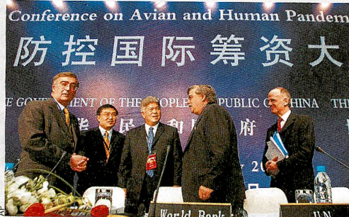
« Cela reste une maladie animale. Mais le risque d'une pandémie est grand », a lancé une responsable de l'OMS.

» En Turquie, le virus vient de tuer une jeune fille de 16 ans, quatrième victime de la maladie hors d'Extrême-Orient. Vingt et une personnes ont été contaminées dans le pays depuis fin décembre, rappelant la réalité de la menace à ceux qui pensaient la contagion humaine limitée à l'Asie. AFP