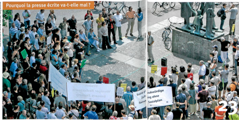
23 Pourquoi la presse écrite va-t-elle mal ?