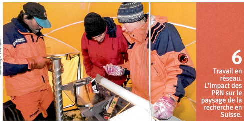
6 Travail en réseau. L'impact des PRN sur le paysage de la recherche en Suisse.