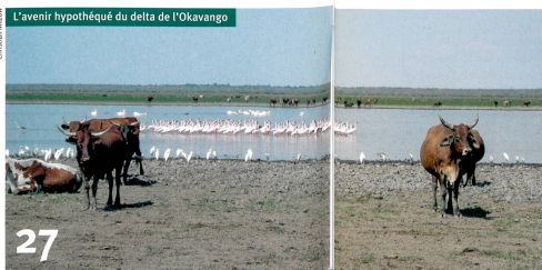
27 L'avenir hypothéqué du delta de l'Okavango