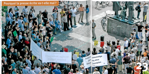
23 Pourquoi la presse écrite va-t-elle mal ?