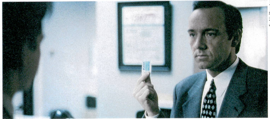
Amateur d'édulcorants. Kevin Spacey dans le film américain « Swimming with Sharks » (1994).

Science, 2009, vol. 324, pp. 636-638. Accès en ligne : www.zora.uzh.ch/18666