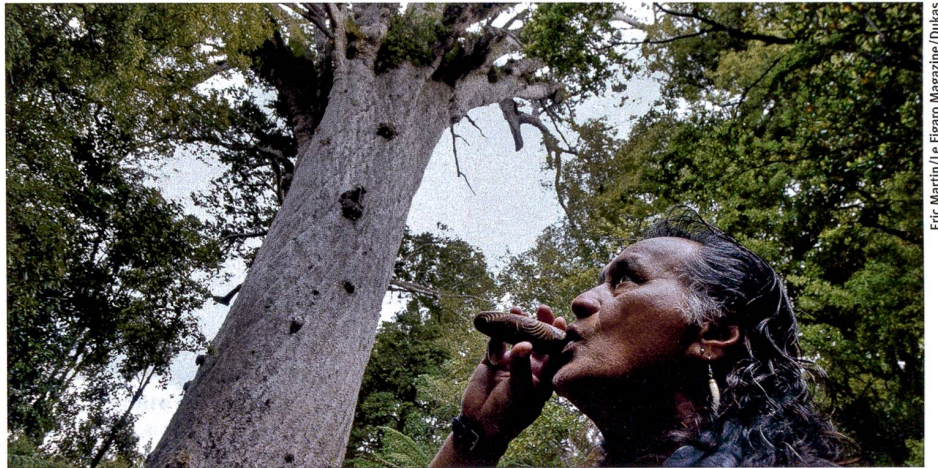
Les troncs des kauris parlent aux climatologues grâce à leurs cernes caractéristiques qui enregistrent les conditions climatiques régionales.