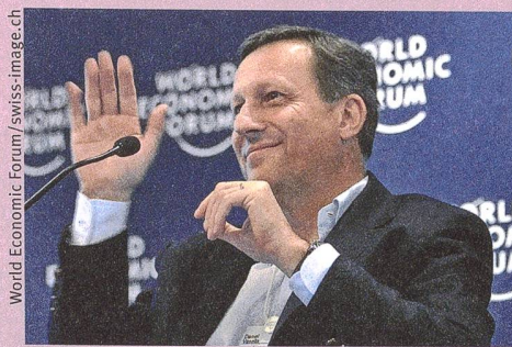
Le salaire et le parachute doré de l'ancien patron de Novartis Daniel Vasella ont suscité la polémique.