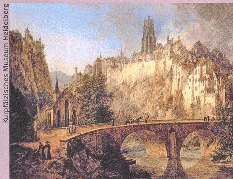
Dans son portrait de la ville de Fribourg (1826), Domenico Quaglio gomme sciemment le progrès technique, l'industrialisation et la pauvreté.

B. Roeck, M. Stercken, F. Walter, M. Jorio, T. Manetsch (éd.): Schweizer Städtebilder. Urbane Ikonographien (15.-20. Jahrhundert) – Portraits de villes suisses. Iconographie urbaine (XVe–XXe siècle) – Vedute delle città svizzere. L'iconografia urbana (XV–XX secolo) . Chronos, Zurich 2013, 640 p., 400 ill. en couleur.