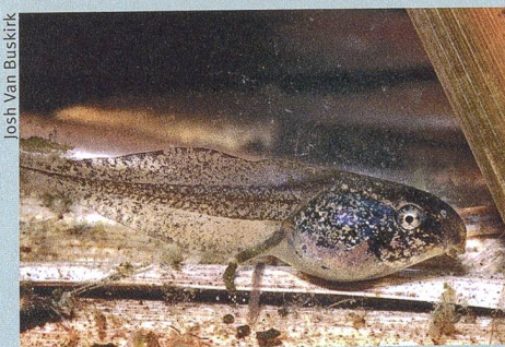
Les têtards affichent de grandes différences de comportement.

Pour ses expériences, Josh Van Buskirk a placé des têtards dans des réservoirs avec des fonds tapissés de feuilles et a constaté de grandes différences de comportement. Les têtards des rainettes passaient beaucoup moins de temps dans leur cachette sous les feuilles que ceux de la grenouille rieuse. Le chercheur a ensuite placé dans les réservoirs des cages contenant des larves de libellules. Celles-ci ne pouvaient pas manger les têtards, mais marquaient leur présence aux moyens de signaux chimiques. Dans ce cas de figure, les têtards des deux espèces ont passé moins de temps à chercher de la nourriture. Le chercheur en conclut que les têtards adaptent certes leur comportement à leur environnement, mais qu'ils peuvent aussi réagir à des ennemis qu'ils n'ont plus rencontrés dans la nature depuis des millions d'années. ori