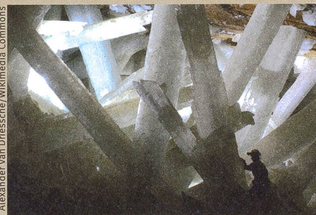
Spectaculaires cristaux de gypse de la mine mexicaine de Naica.

Y. Krüger, J. M. García-Ruiz, À. Canals, D. Martí, M. Frenz, A.E.S. Van Driessche: Determining gypsum growth temperatures using monophasic fluid inclusions – Application to the giant gypsum crystals of Naica, Mexico , dans: Geology (2013), 41, 2, 119–122.