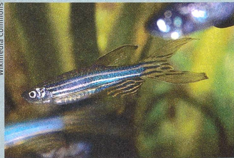
Le poisson zèbre est capable de régénérer son cœur après un infarctus.