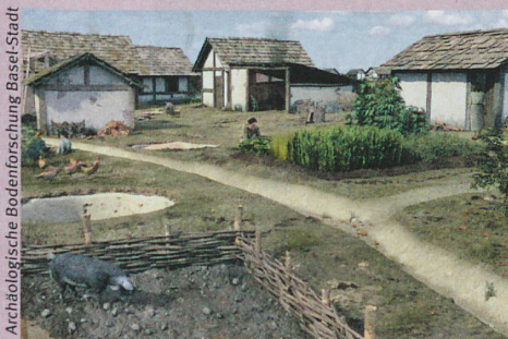
Reconstruction de la cité celte bâloise datant de 100 av. J.-C. environ.