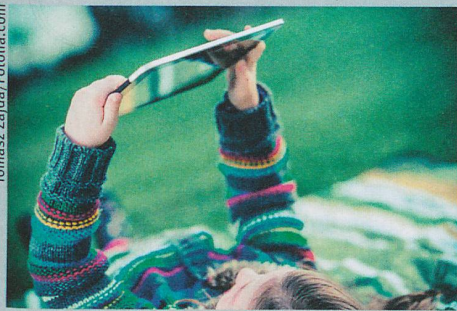
Tous les enfants cancéreux devraient être intégrés dans des études cliniques.