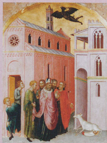
Une biche allaite saint Stéphane dans cette peinture de Martino Di Bartolomeo (vers 1435).

Y. Foehr-Janssens et al.: Représentations de l'allaitement au Moyen Âge: invisibilité ou prolifération matérielle et légendaire. Soumis à: Allaitement et pratiques de sevrage: approches pluridisciplinaires et diachroniques (Paris, Ed. de l'INED), 2015