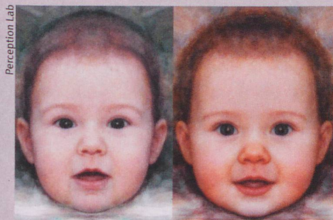
Quel est le bébé le plus mignon?

J.S. Lobmaier et al.: Menstrual cycle phase affects discrimination of infant cuteness. Hormones & Behavior , 2015