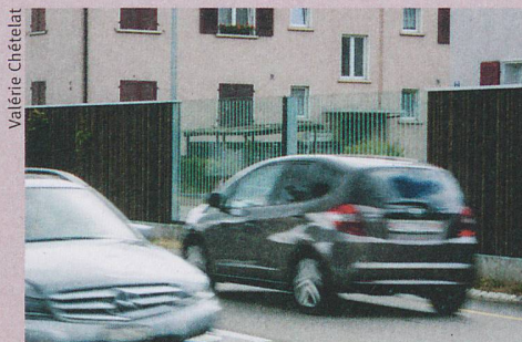
La norme sociale pourrait encourager la conduite silencieuse.