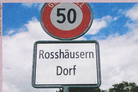
Derrière ce nom se cache un certain «Rudolf».

Ortsnamenbuch des Kantons Bern, volume 5 à paraître en automne 2015. A. Francke Verlag, Bâle et Tübingen